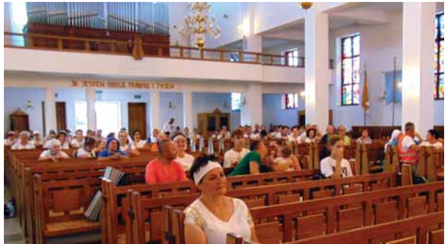
Pielgrzymi podczas wspólnej modlitwy w kościele.