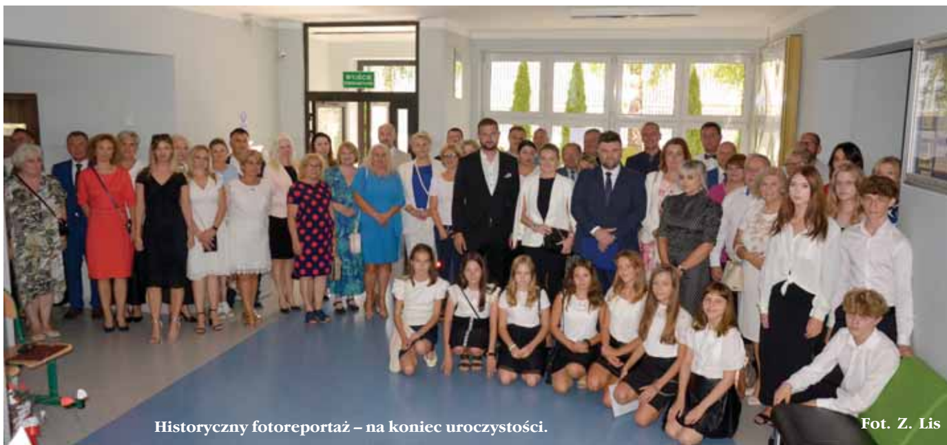
Historyczny fotoreportaż – na koniec uroczystości.