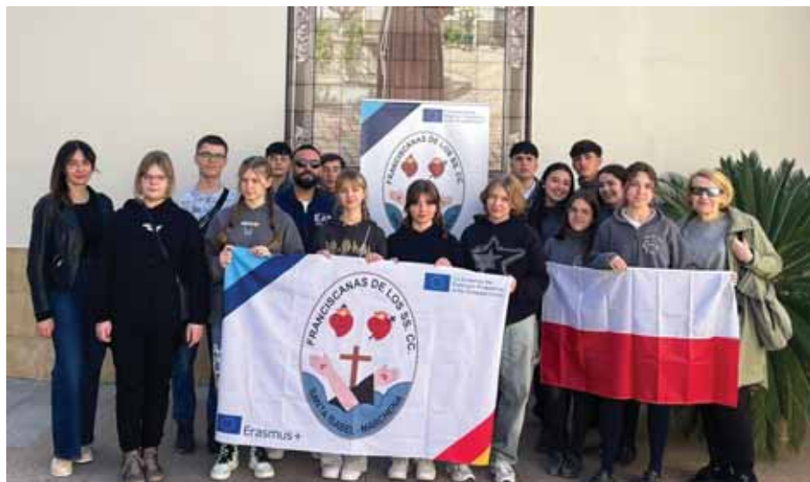
Erasmus+ - wizyta w szkole partnerskiej. Marzec 2024 r.