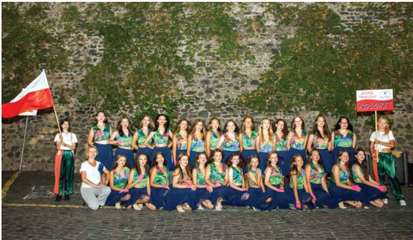
Zespół Taneczny „Koloret” – rozpoczęcie festiwalu.