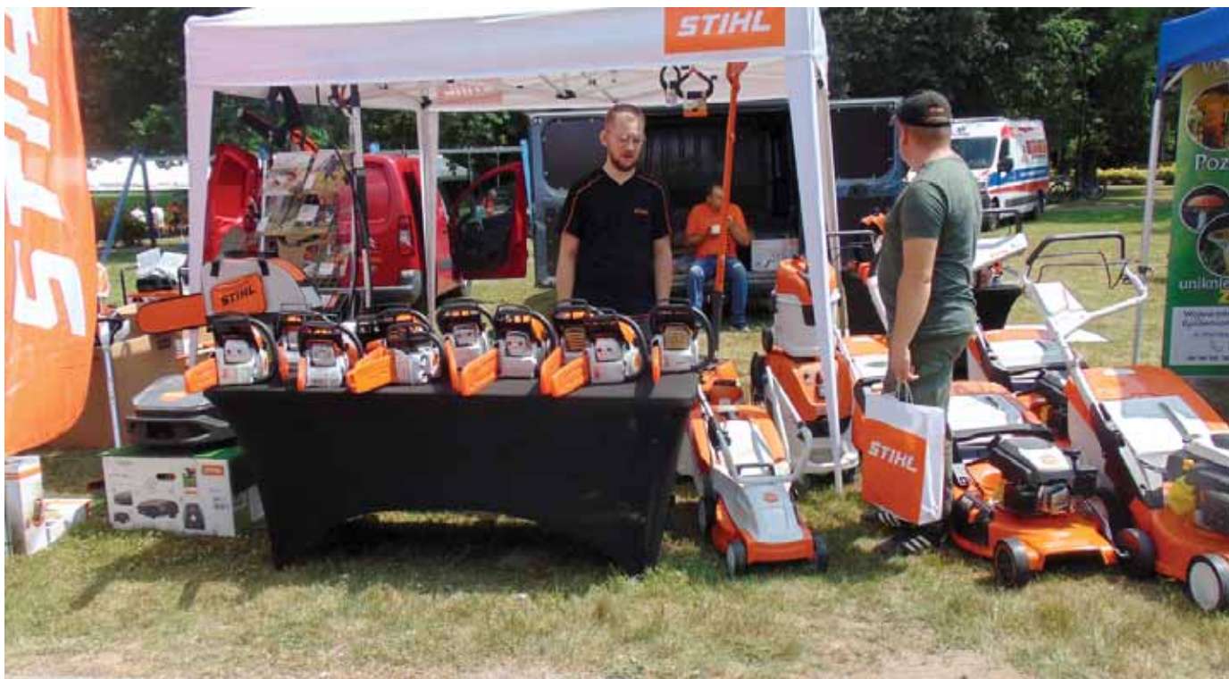
Stoisko promocyjne firmy Stihl.