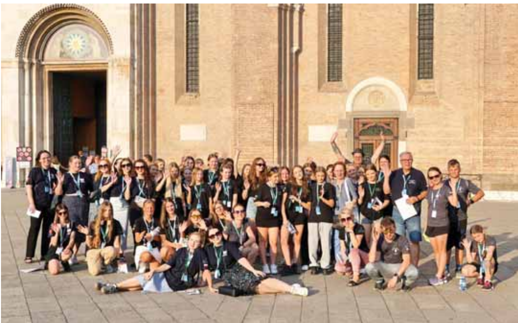
Padwa – Bazylika św. Antoniego.

Zaczęliśmy poniedziałek wcześniej, aby dotrzeć do Rzymu zanim włoskie słońce stanie na wysokości zadania.