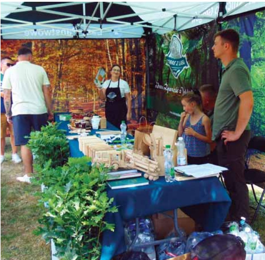
Stoisko „Dobre, bo z lasu”.

o kulinarną oprawę imprezy (stoisko gastronomiczne, napoje chłodzące itp. Dla dzieci atrakcją były tzw. dmuchańce oraz „Strzelnica laserowa”.