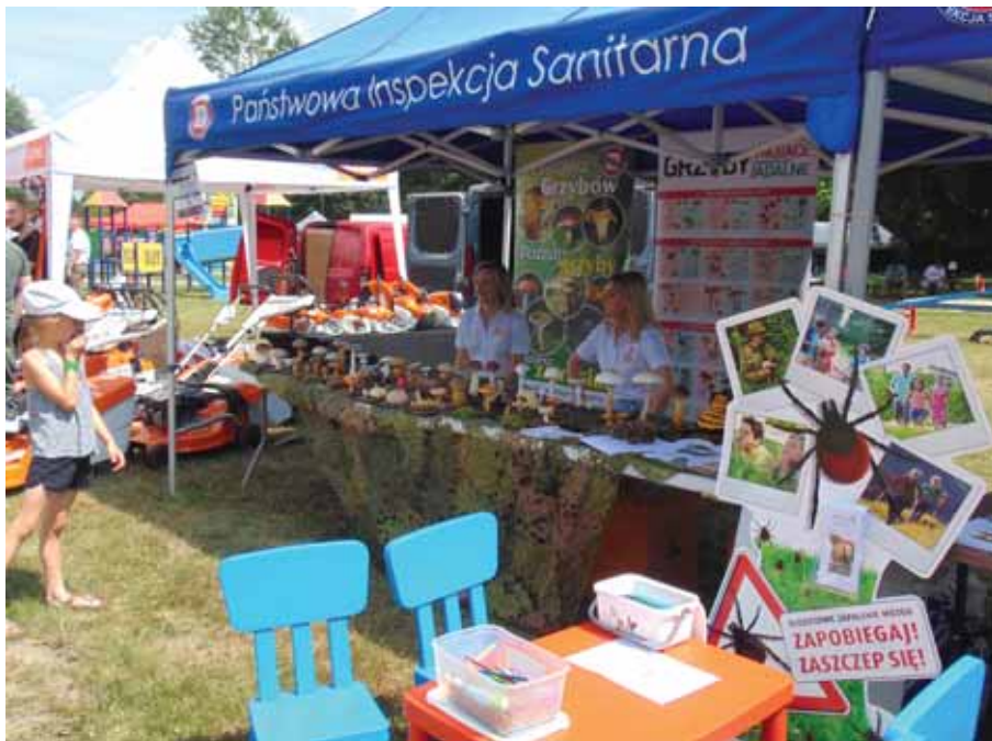
Stoisko „Poznaj grzyby”.