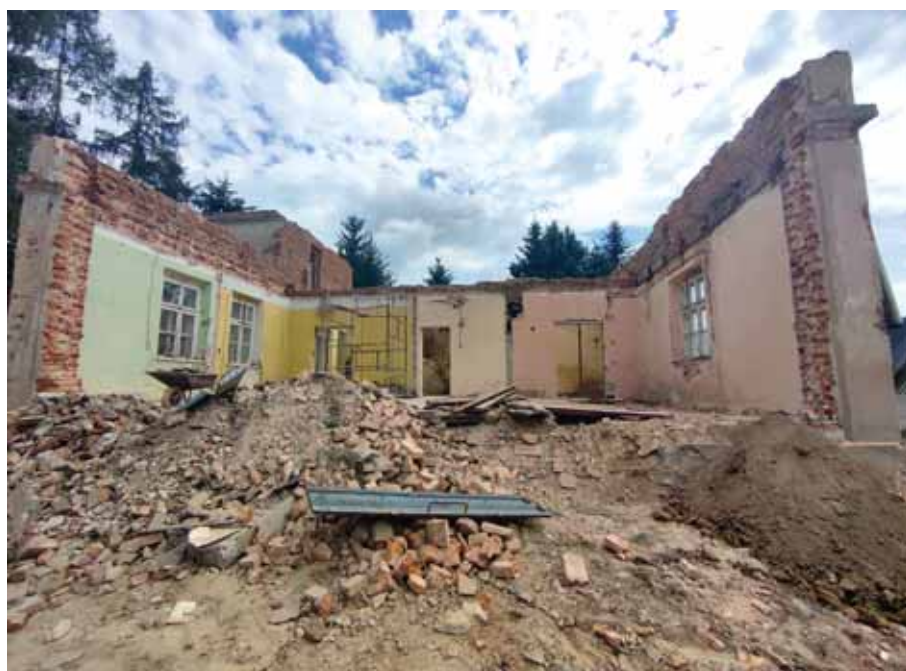
Prace budowlane – Żłobek Świlcza.