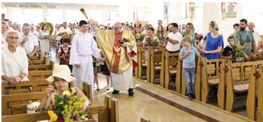
Poświęcenie ziół i kwiatów.

Papież Jan Paweł II – powiedział: „Oddaję hołd spracowanym ręką