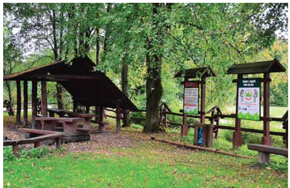
Miejsce na skraju lasu, gdzie można odpocząć i wyruszyć na trasę Ścieżki Edukacyjno-Przyrodniczej.