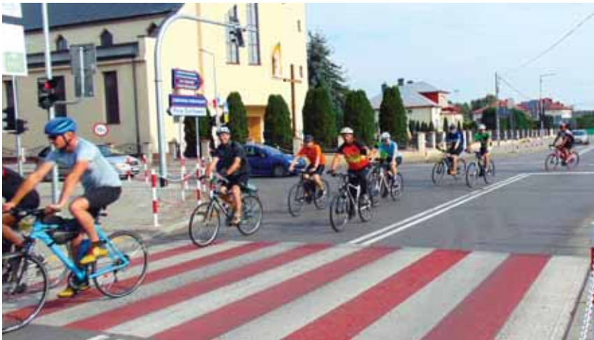
Pielgrzymi już w centrum Bratkowic.

Organizatorem tegorocznej 45. Pielgrzymki Rowerowej im. św. Krzysztofa i wcześniejszych jest Podkarpackie Stowarzyszenie Turystyczno-Sportowe NSZZ „Solidarność” w Rzeszowie.