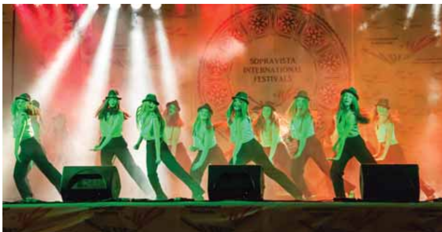
Koloret podczas koncertu.