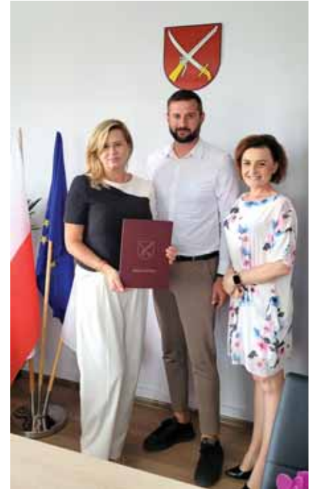
Podpisanie umowy z firmą MATBUD.

współfinansowanego z Programu Rządowego Fundusz Polski Ład: Program Inwestycji Strategicznych pn.: „Modernizacja infrastruktury drogowej na terenie Gminy Świlcza”. Wykonawcą zadania wyłonionym w postępowaniu przetargowym została firma MATBUD Sp. z o.o. z Rzeszowa.