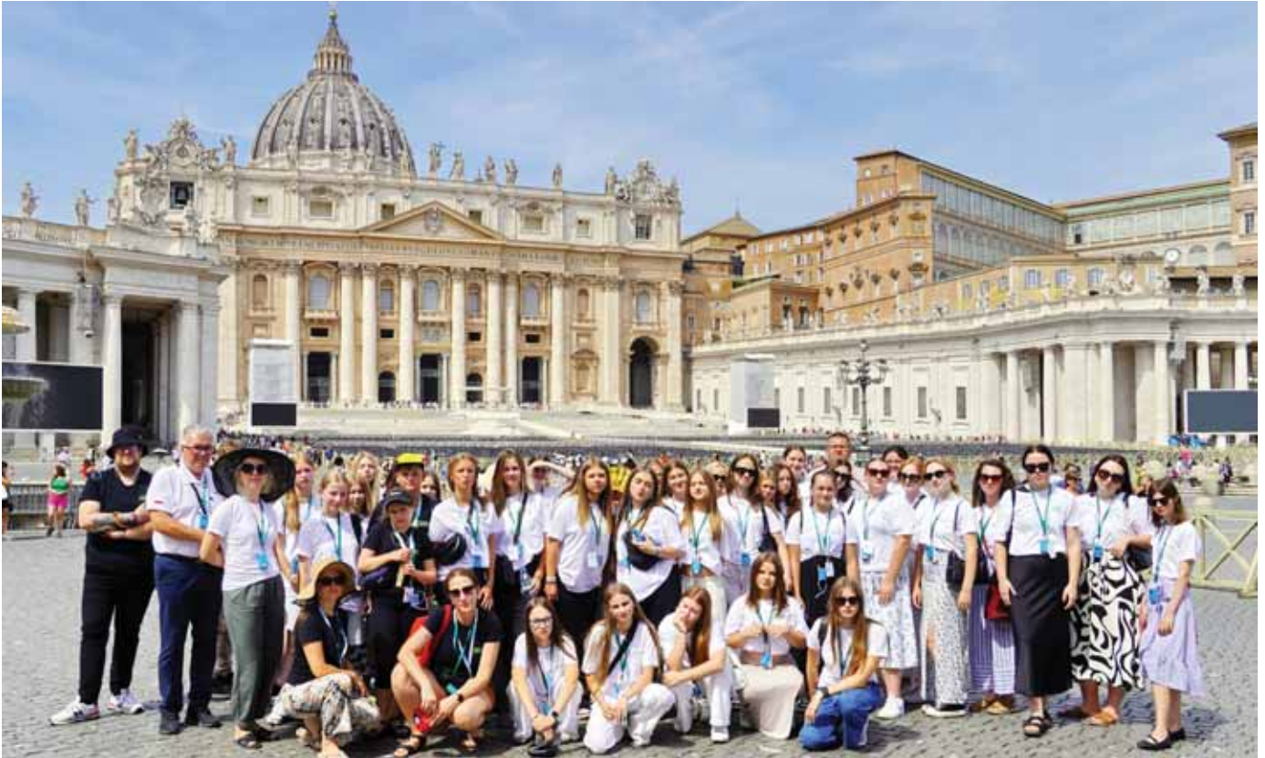
Watykan – Plac Świętego Piotra.