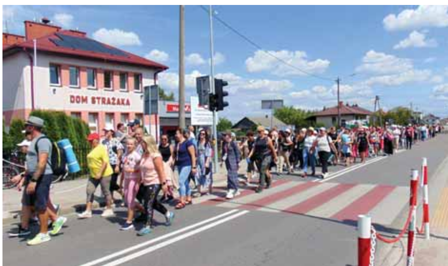
Pielgrzymi dotarli do centrum Bratkowic.