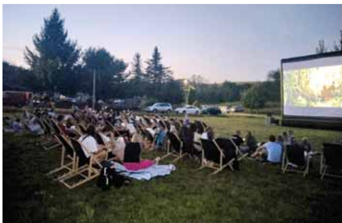
Seans w Błędowej Zgłobieńskiej.

Organizatorem wydarzeń jest Gminne Centrum Kultury, Sportu i Rekreacji w Świlczy z siedzibą w Trzcianie. Udział w wydarzeniach jest bezpłatny.