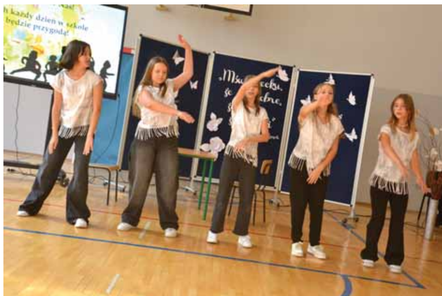
Młodzież szkolna wystąpiła w programie artystycznym.