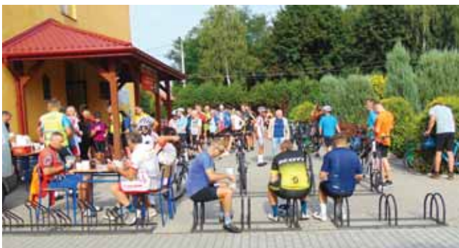
Pierwszy odpoczynek i posiłek na placu Szkoły Podstawowej nr 1.