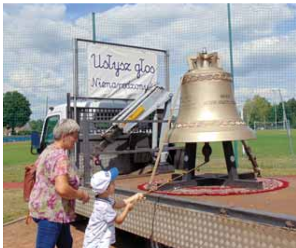
Każdy mógł uderzyć w dzwon – głos nienarodzonych.

Po około godzinnym odpoczynku pątnicy, wyruszyli w dalszą drogę na Jasną Górę. Opuszczając Bratkowice, radosnym śpiewem dziękowali mieszkańcom za serdeczne i gościnne przyjęcie, a miejscowym gospodyniom, za przygotowane smaczne dania, ciasta i kompoty. Po kilku godzinach wędrówki dotarli do Kamionki. W ten sposób zakończyli swój pierwszy etap pielgrzymowania na trasie Rzeszów-Kamionka, pokonując 32 km. Następnego dnia