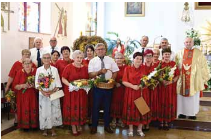
Grupa wieńcowa Koła Gospodyń Wiejskich i wieniec dożynkowy.