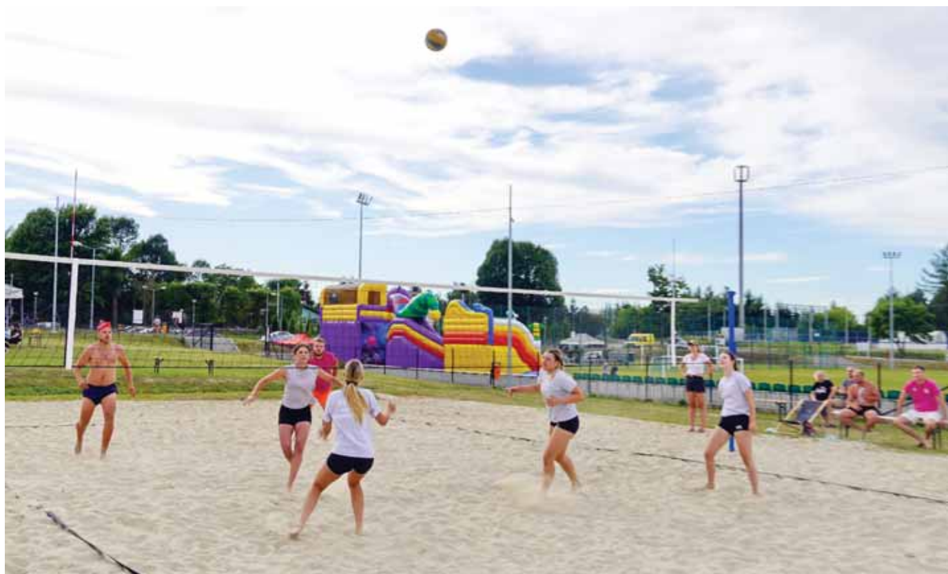
Piłka w grze koło stadionu w Trzcieńcu.

współpracy z Gminnym Centrum Kultury Sportu i Rekreacji w Trzcieńcu oraz Wójtem Gminy Świlcza. ■