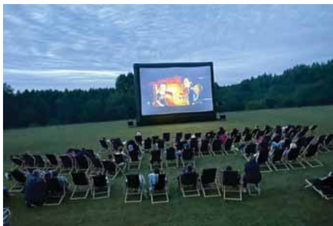
Seans w Woliczce.