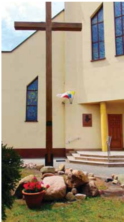
Krzyż Misyjny ustawiony jest na placu przed kościołem.

czerwca 2024 r. W okresie przygotowań do tego ważnego wydarzenia religijnego parafianie, po każdej Mszy św., odmawiali wspólnie modlitwę w intencji Misji Świętych: „ O dobry i miłosierny Boże Prosimy Cię o bło-