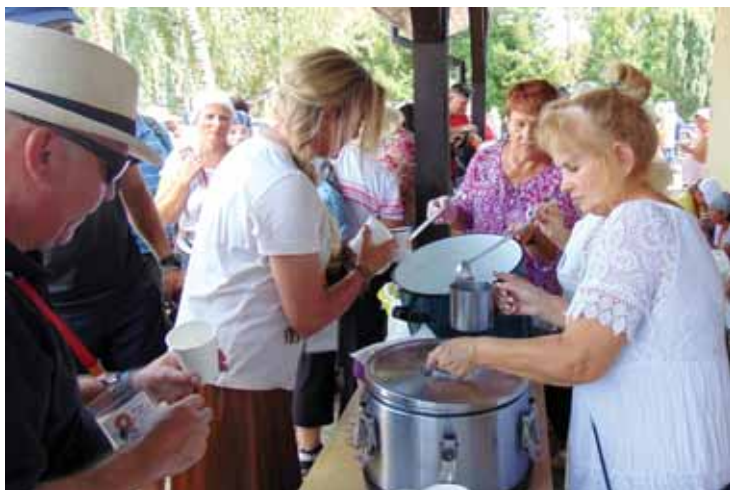
Bratkowickie gospodynie przygotowały dla pątników gorące dania.

Bardzo ważnym i wymownym akcentem tegorocznej 47. Rzeszowskiej Pieszaj Pielgrzymki na Jasną Górę, był dzwon z napisem: „Głos Nienarodzonych”. Dotarł on do Bratkowic wraz z pielgrzymami na samochodzie specjalnie do tego celu przystosowanym. Zapisane na dzwonie słowa gorliwie-