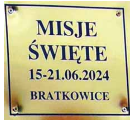
Pamiątkowa tabliczka Misji Świętych w bratkowickiej parafii, umieszczona jest na Krzyżu Misyjnym.

Na pamiątkę Misji Świętych parafianie mogli zakupić małe krzyżyki