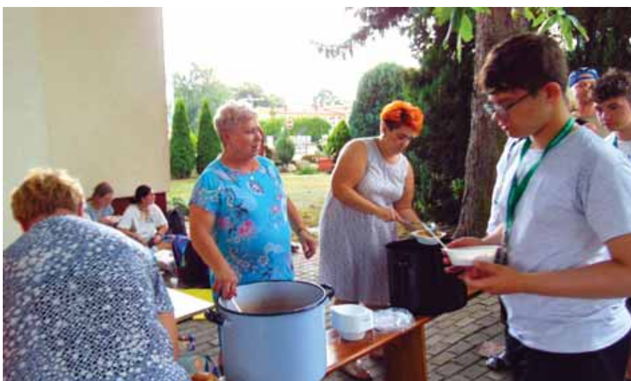
Bratkowickie gospodynie przygotowały ciepłe dania dla pielgrzymów.

pragnienie. Gorące dania, ciasta i kompoty, przygotowały dla każdej z grup mieszkanki zachodniej części parafii (Przywary, Czekaj). Wszystkim paniom gospodyniom z Bratkowic, należą się słowa najwyższego uznania i podziękowania, za gościnność i okazaną życzliwość.