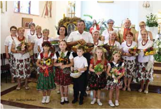
Grupa wieńcowa Akcji Katolickiej i wieniec dożynkowy.