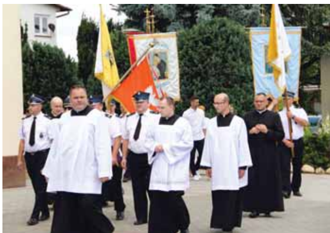
Księża podczas procesji.