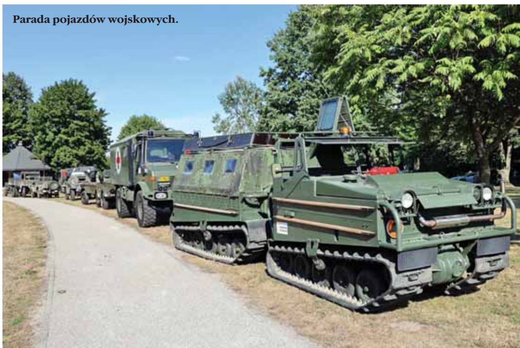
Parada pojazdów wojskowych.

– „Akcja „Burza” w naszym regionie była symbolem niezłomności ducha, gotowości do poświęceń oraz