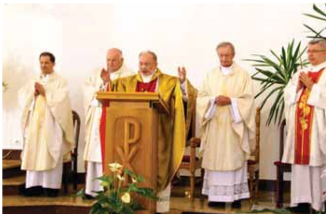
Podczas Mszy św.