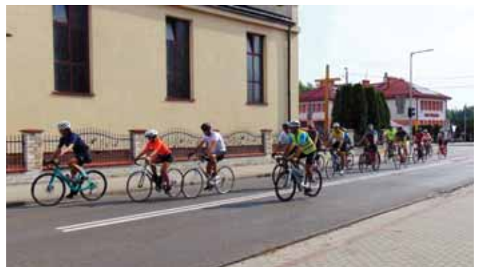
Pielgrzymi opuścili Bratkowice.