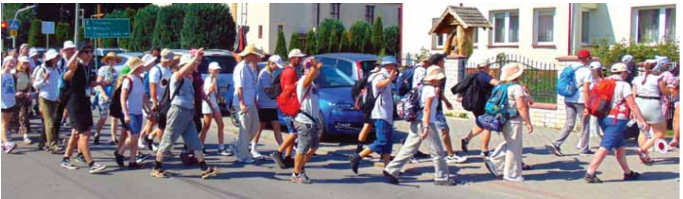
Pielgrzymi udają się na plac przed plebanią na odpoczynek.