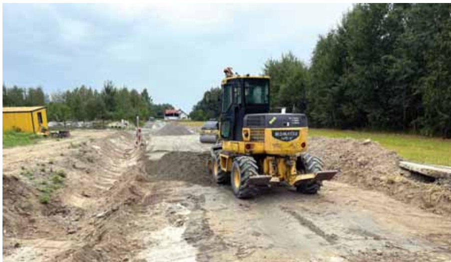
Przebudowa drogi w Mrowli.

• Trwa przebudowa drogi gminnej nr 137113R w Mrowli w ramach zadania pn.: „Rozbudowa drogi gminnej nr 137113R w km 0+000 – km 0+215 wraz z niezbędną infrastrukturą techniczną oraz przebudową sieci w miejscowości Mrowla”, której długość do rozbudowy to 215 mb a szerokość 4 mb. Zakres obejmuje przebudowę skrzyżowania z drogą gminną nr 137115R, budowę zjazdów indywidualnych, wykonanie urządzeń wodnych, przebudowę kolidujących sieci uzbrojenia terenu tj. energetycznej oraz wodociągowej, wykonanie oznakowania pionowego i poziomego oraz montaż urządzeń bezpieczeństwa ruchu drogowego. War-