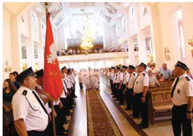
Strażacy podczas Mszy św.