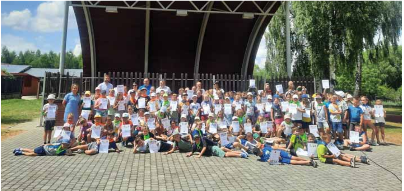
Tabela 2. Wyniki egzaminów ósmoklasisty w 2024 r. – rok szkolny 2023/2024*

gminną, w której wzięło udział 126 uczniów szkół prowadzonych przez gminę Świlcza. Opiekę nad nimi sprawowało 10 opiekunów. Dofinansowanie ze strony gminy na ten cel wyniosło prawie 17 500 zł. Każdy dzień został szczegółowo zaplanowany. Wszyscy uczniowie mieli zapewnione wyżywienie oraz dojazd w każde miejsce spędzania wolnego czasu