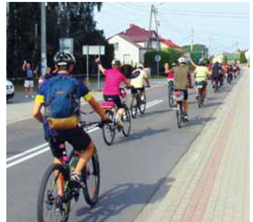
Po drodze pątnicy byli pozdrawiani przez mieszkańców.