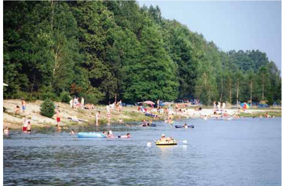
W każdy letni weekend plaża nad zalewem tętni życiem, a w okresie wakacyjnym nad zalewem wypoczywa mnóstwo ludzi.

wyznaczony plac do gry w siatkówkę plażową, gastronomiczny punkt sprzedaży frytek. Była również możliwość zamówienia telefonicznego np. placków ziemniaczanych z ogórkami i śmietaną oraz frytek tzw. ciosanych. Ponadto tuż przy wejściu na plażę, umieszczony jest na metalowej konstrukcji regulamin korzystania z kąpieliska, w którym podane są numery telefonów do odpowiednich służb, m.in. Straży Gminnej, Policji, Straży Pożarnej, Pogotowia Ratunkowego i numer alarmowy 112. Na terenie przyległym do zalewu i plaży, rozstawione są liczne pojemniki na śmieci, dzięki temu jest względnie czysto.