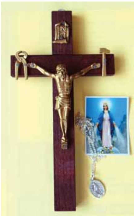
Pamiątka Misji Świętych – mały Krzyż i Medalik.

Środa – „ Gdy przystępujesz do spowiedzi św. obmywa cię Krew i Woda, które wyszły z serca mego ” – powieździał Jezus do Faustyny. Różaniec i Msza św. z ogólną nauką misyjną. Spowiedź św. Koronka do Miłosierdzia Bożego. Msza św. za zmarłych mi procesja wiernych na cmentarzu parafialny z zapalonymi zniczami.