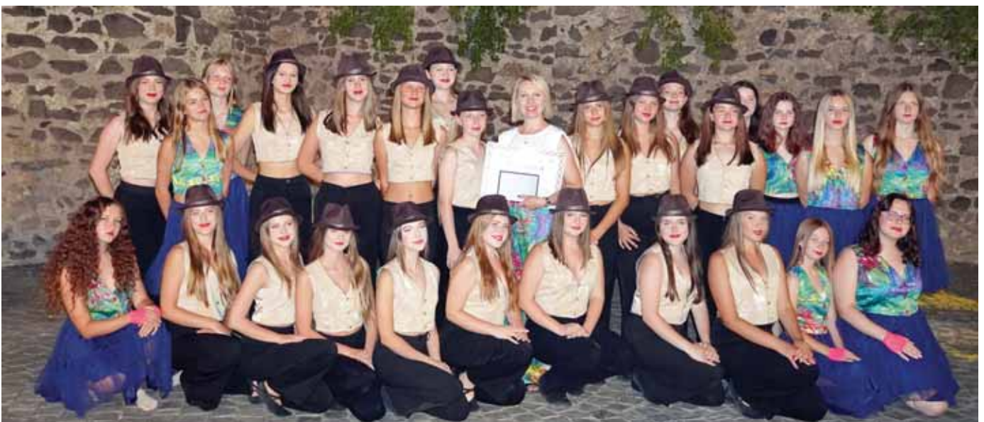
Zespół Taneczny „Koloret” – koncert galowy.

mamy z tego wyjazdu jeszcze coś – coś, co nie zmieściłoby się w żadnym bagażu, czego nie zamknijemy w pudełku ani nie uwiecznimy na fotografii – to wspomnienia, zbudowane relacje, nawiązane znajomości. To ciepłe uśmiechy, miłe słowa. To porozumienie międzyjęzykowe, kiedy umiemy się dogadać nawet bez znajomości języka włoskiego. To przepyszne włoskie jedzenie, ciepłe słońce. Zapach wakacji, przyjaźni i radości.