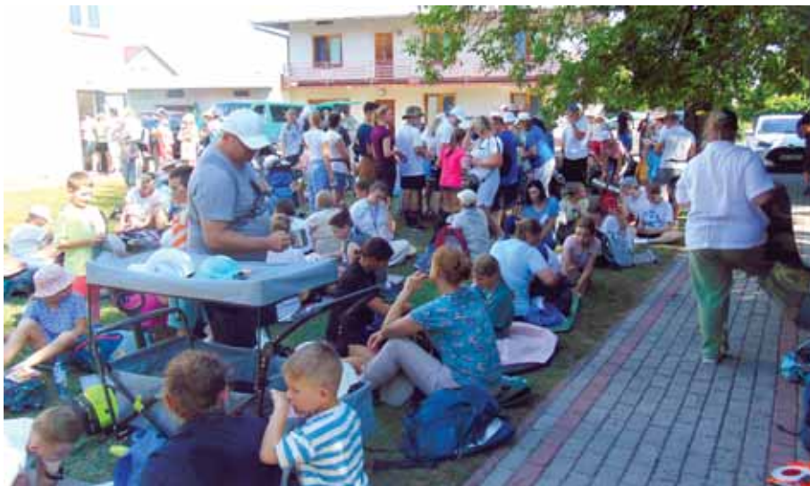
Odpoczynek i posiłek na placu przed plebanią.