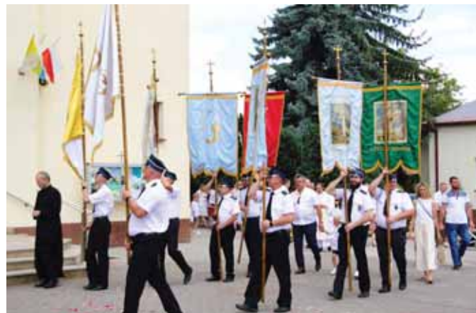
Procesja odpustowa z udziałem miejscowych strażaków