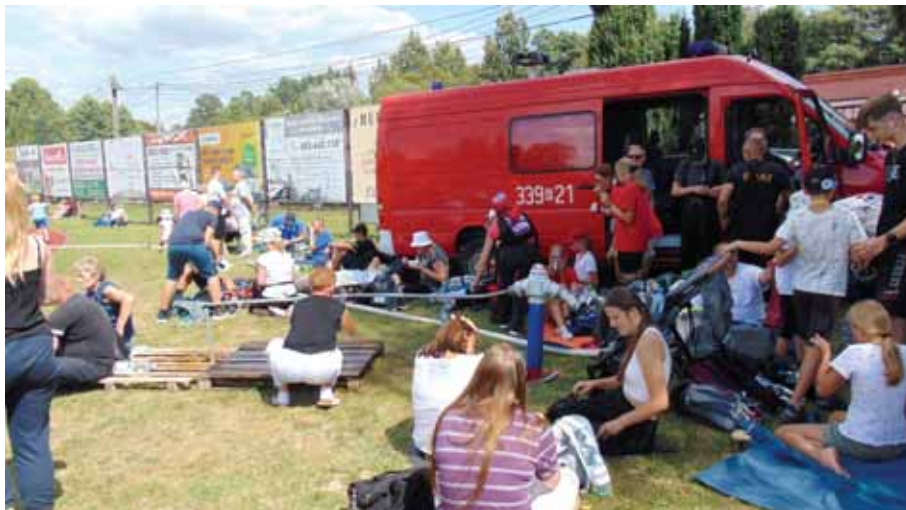
Miejscowi strażacy corocznie angażują się w pomoc pielgrzymom.