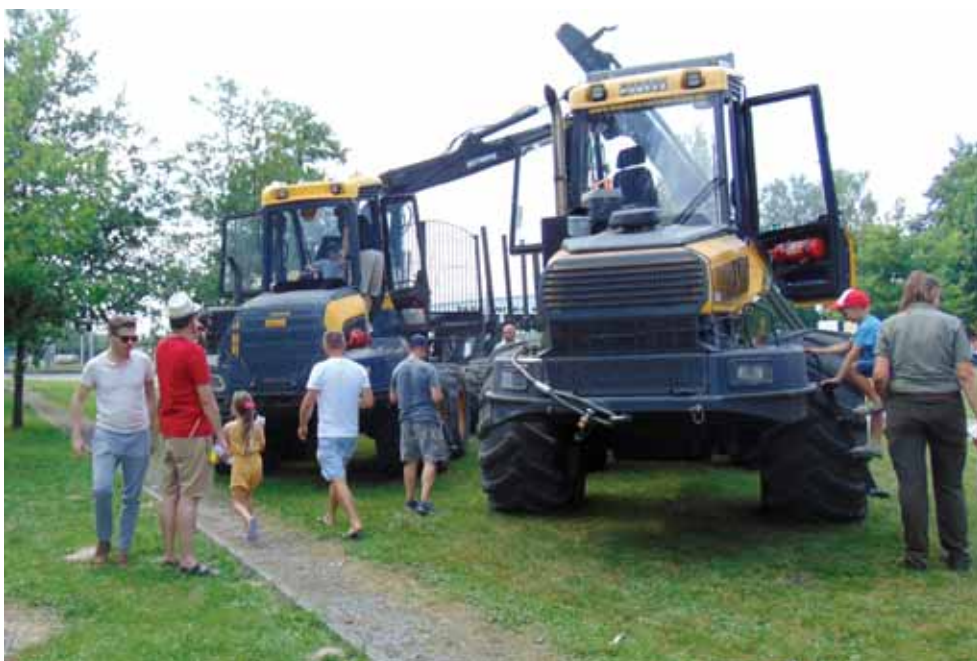
Maszyny leśne najbardziej podobały się dzieciom.

W ramach tej plenerowej imprezy, organizatorzy przygotowali wiele niespodzianek i atrakcji, zarówno dla dorosłych, jak i dla dzieci m.in. warsztaty edukacyjne pn. „Spacer z leśnikiem”, wystawa „Poznaj grzyby – uniknij zatrucia” wraz ze stoiskiem profilaktycznym dla dzieci i rodziców, degustacja produktów marki „Dobre z lasu” (darmowa degustacja dziczyzny), pokaz wielooperacyjnych maszyn