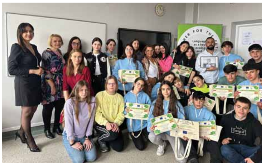
Wizyta szkoły partnerskiej.