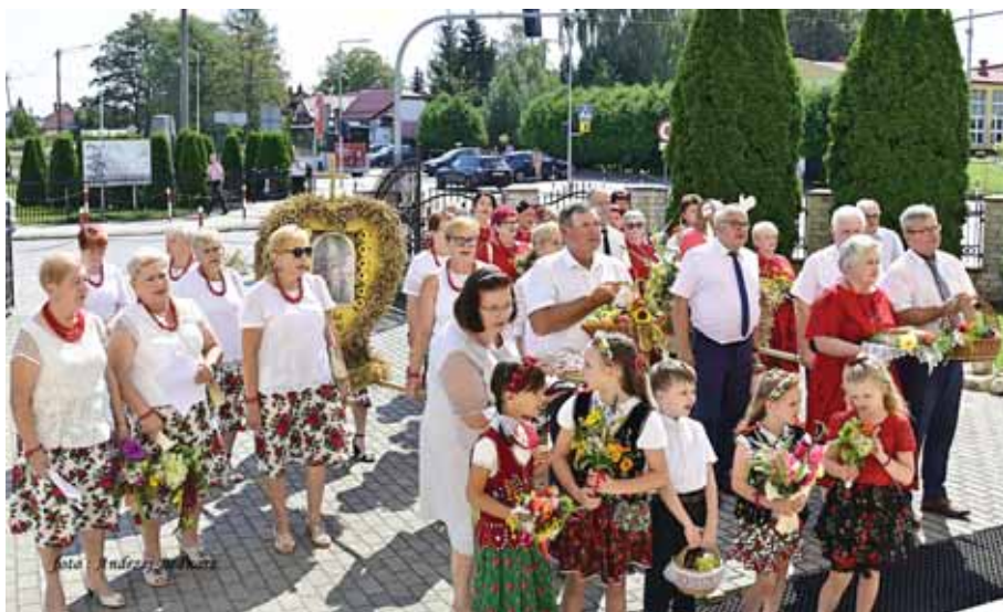
Grupy dożynkowe przed wejściem do kościoła.