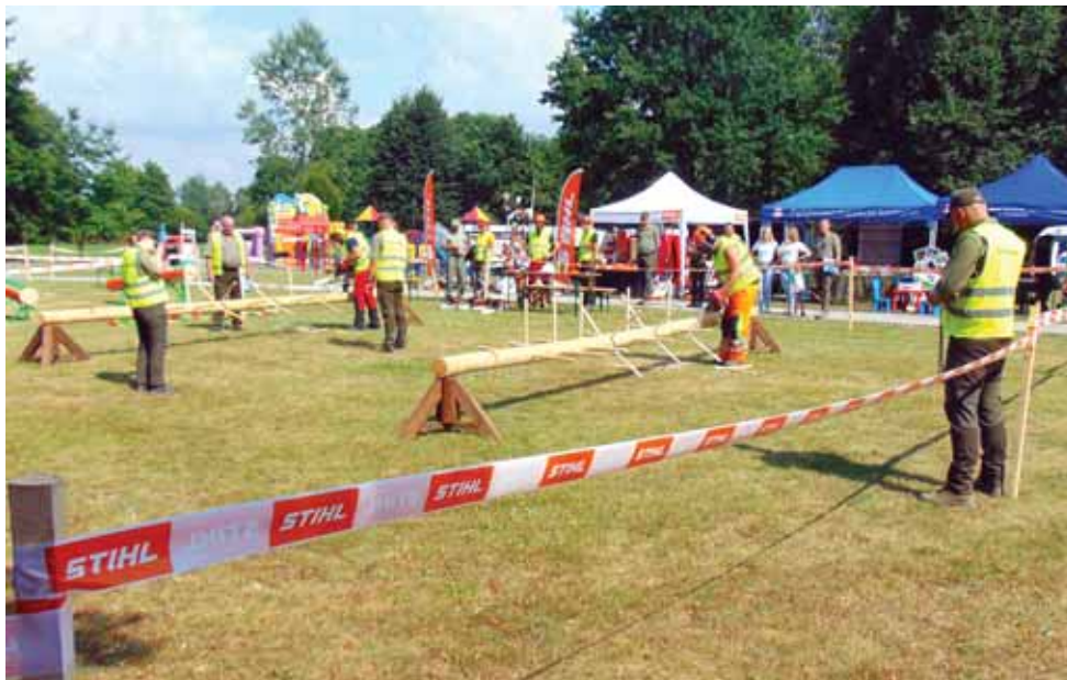
Konkurencja – okrzesywanie.

i higieny pracy, co jest bardzo ważne podczas wykonywania różnych niebezpiecznych prac leśnych. W zmaganiach uczestniczyli doświadczeni drwale, wykonujący na co dzień ciężką i niebezpieczną pracę na terenie lasów podległych Nadleśnictwu Głogów Młp.