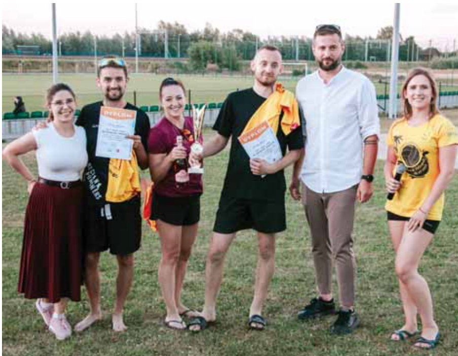
Wręczenie nagród drużynie zwycięskiej Zbyt Pewni Siebie .

W ramach nagród za pierwsze trzy miejsca drużyny otrzymały puchary,