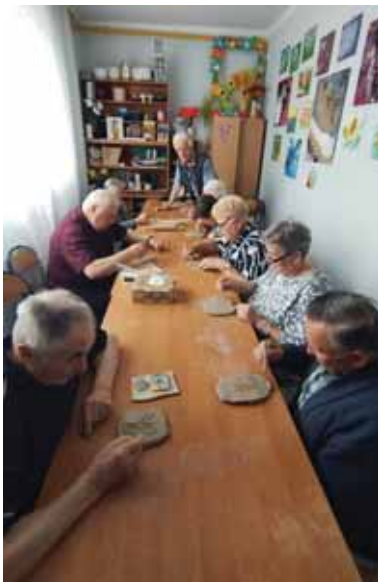
Zajęcia w Domu Seniora w Bratkowicach.