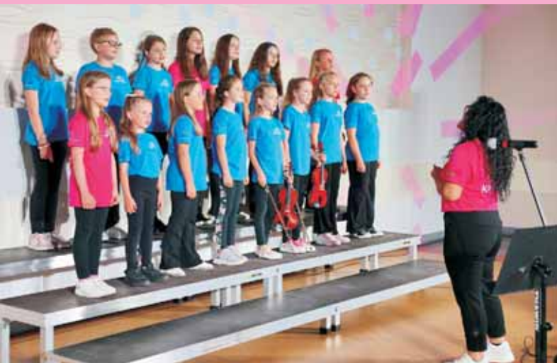
Chór dziecięcy „Kantuski”