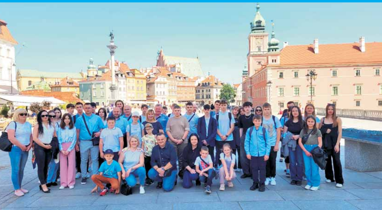
Wyjazd MRG - Starówka Warszawa.