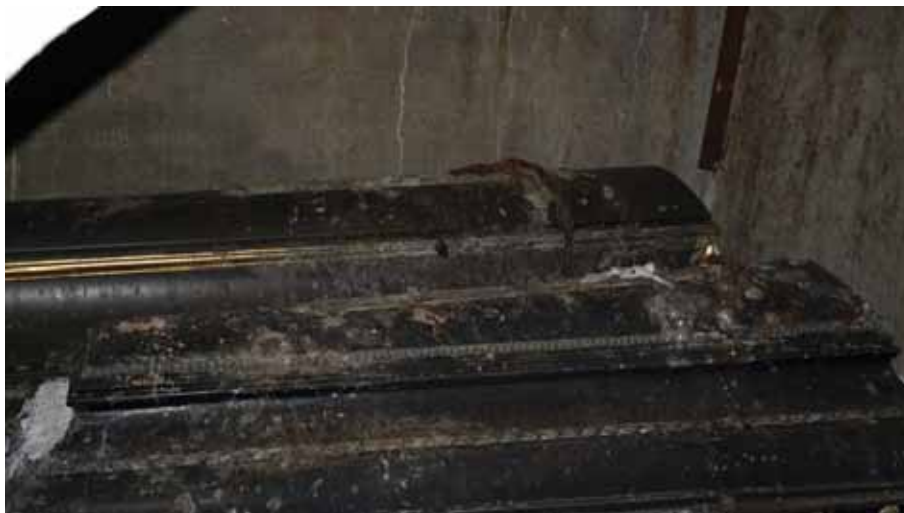
Wnętrze krypt grobowych rodziny Dąmbskich.

Zarząd TPS składa podziękowanie dla Samorządu Gminy Świlcza (prace wykonane przez grupę pod kierownic-