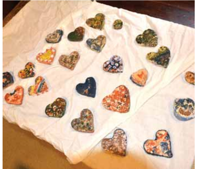
Prace ceramiczne dzieci z SP w Trzcianie.