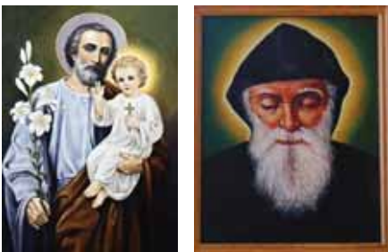
Obraz olejny św. Józefa z Dzieciątkiem Jezus i św. Charbela.