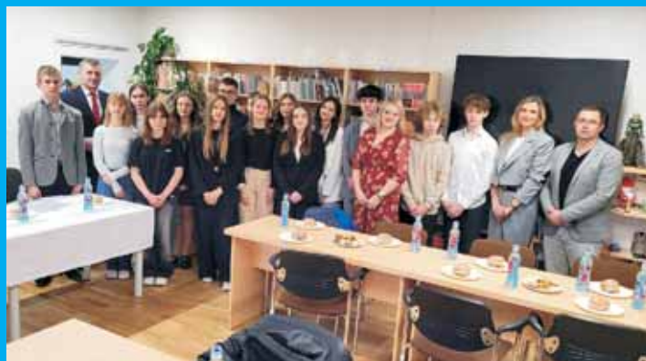
II Sesja MRG V Kadencji.