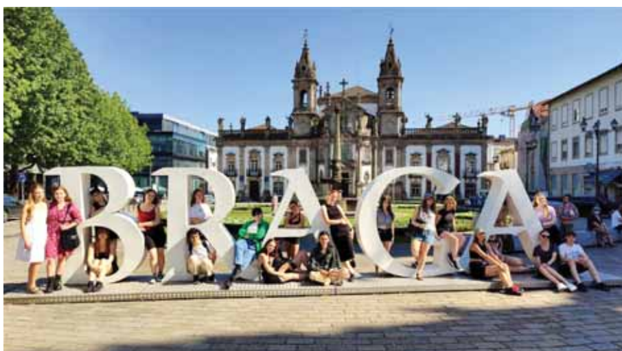
Młodzież z ZST-W w czasie zwiedzania Porto i Bragi.