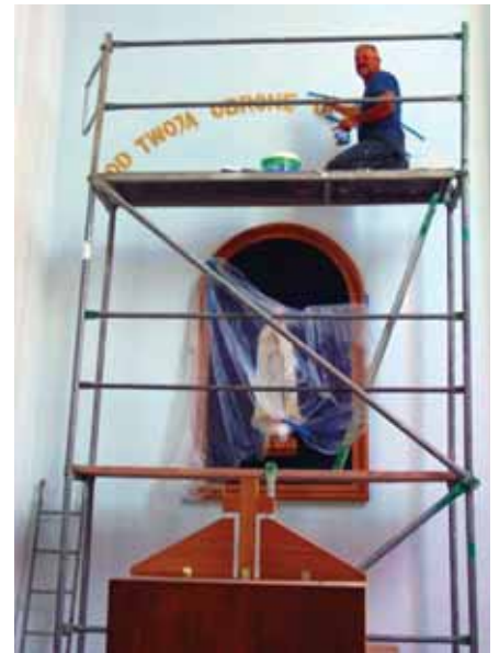
Prace malarskie przy ołtarzu wykonał Józef Jucha.