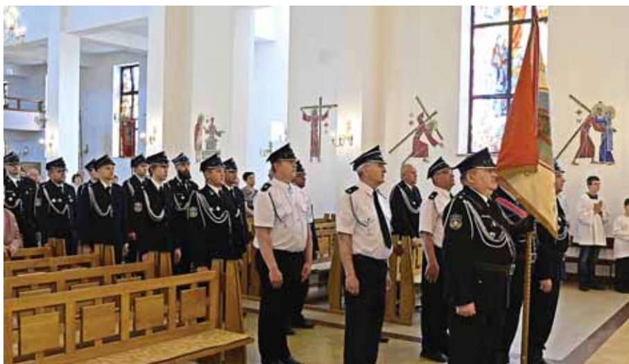
Strażacy podczas uroczystej Mszy św.