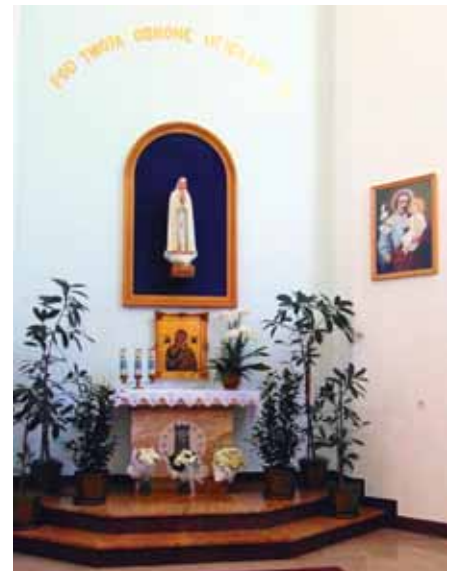
Odnowiony ołtarz Matki Bożej Fatimskiej. Obok obraz św. Józefa.