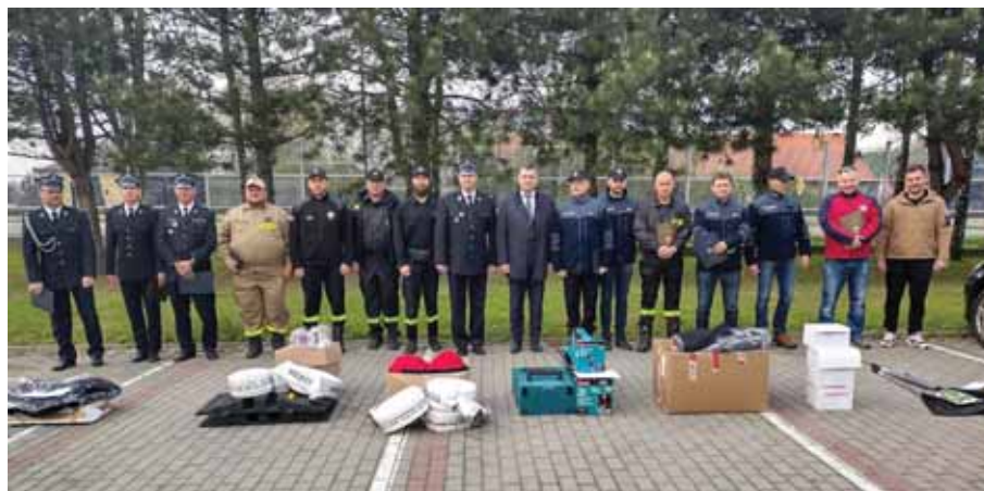
Doposażenie OSP wzmacnia poczucie bezpieczeństwa.

Dzięki doposażeniu jednostek OSP samorząd gminny podnosi ich sprawność operacyjną, a co za tym idzie wprowadza poczucie spokoju i bezpieczeństwa wśród mieszkańców gminy Świlcza w przypadku wystąpienia zagrożeń.