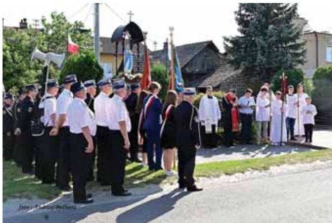
Uroczysta majówka przed kapliczką Grunwald.