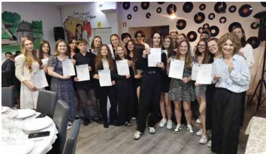
Młodzież ZST-W wraz z opiekunami w czasie uroczystości wręczania certyfikatów na zakończenie stażu.

Osiągamy to poprzez uczestnictwo w kursach zawodowych oraz job shadowing czyli obserwacji pracy za granicą. Tego typu inicjatywy przynoszą wiele korzyści zarówno dla nich samych, szkoły oraz szkolnictwa jako całości. W bieżącym roku szkolnym 2. nauczycielki technikum żywienia i usług gastronomicznych uczestniczyły w kursie Italian cooking and UNESCO Mediterranean diet: an interactive experience! organizowanym w Padwie, we Włoszech, gdzie zgłębiały tajniki tradycyjnej włoskiej kuchni. Zdobytą wiedzę przełożą młodzieży podczas zajęć praktycznych.