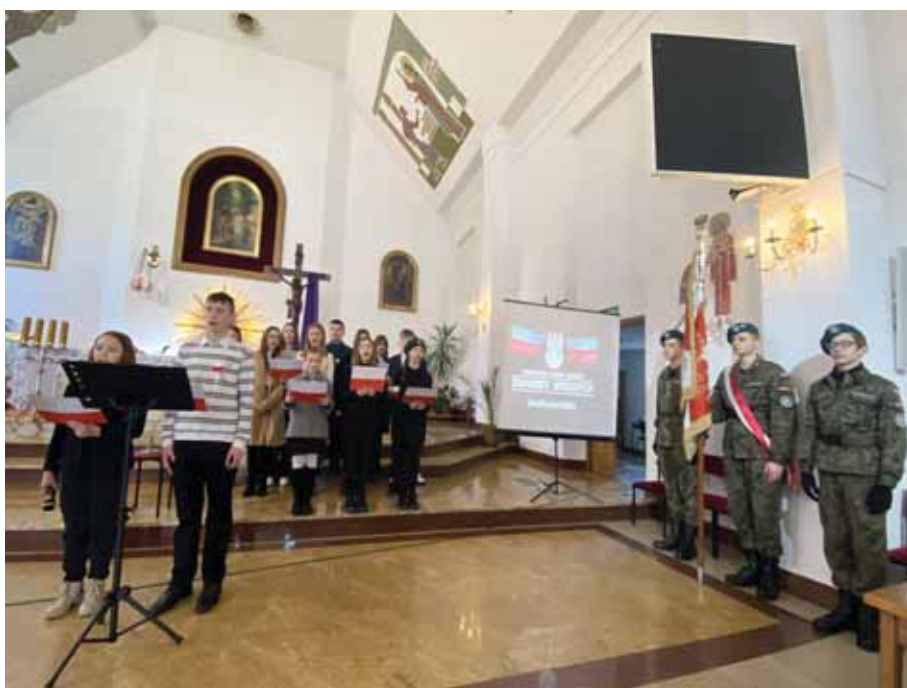
Patriotyzm to nasz zaszczyt i obowiązek.