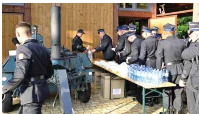
Grochówka wszystkim smakowała.