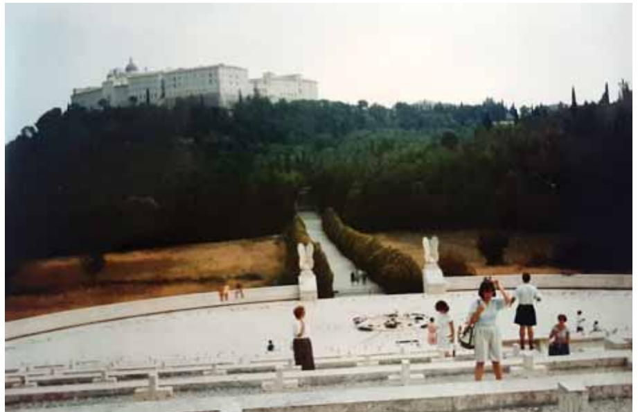
Monte Cassino, rok 1996 - widok na Klasztor Benedyktynów.

18 maja przypada także 80. rocznica bitwy o Monte Cassino. To najśłynniejszy epizod bojowego szlaku armii gen. Władysława Andersa. Średniowieczny