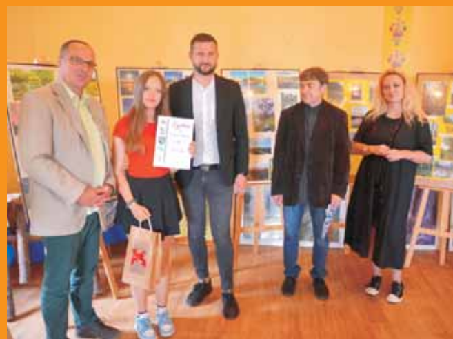
Dobre – długo się pamięta.