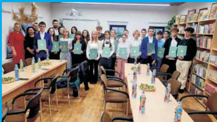
I Sesja MRG V Kadencji.

– głos młodego pokolenia w Samorządzie Gminy Świlcza