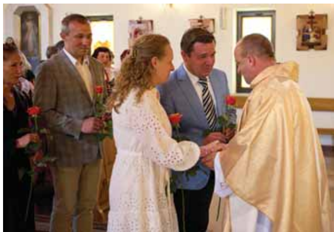
Przewodnicząca KGW i dyrekcja szkoły składają życzenia.