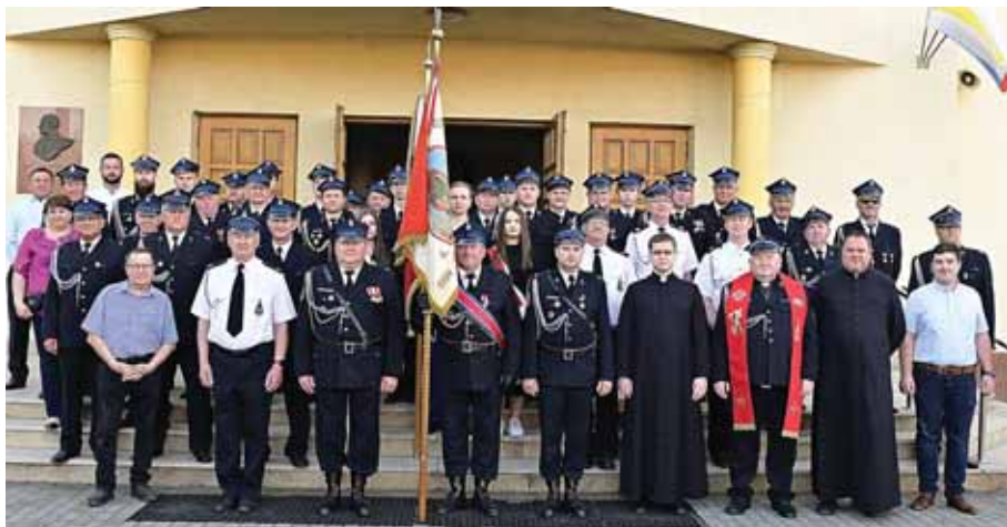
Pamiątkowe zdjęcie przed kościołem.

kapliczką ks. kan. J. Książek, przybliżył wszystkim zgromadzonym historyczny okres Polski będącej pod zaborami i trudnej drodze do niepodległości. Przypominał również historyczne wydarzenie związane z uchwaleniem w 1791 r. bardzo ważnej dla Polski i Polaków Konstytucji 3 Maja (pierwszej w Europie po Stanach Zjednoczonych Ameryki). „Mieszkańcy Bratkowic – powiedział ksiądz pro-