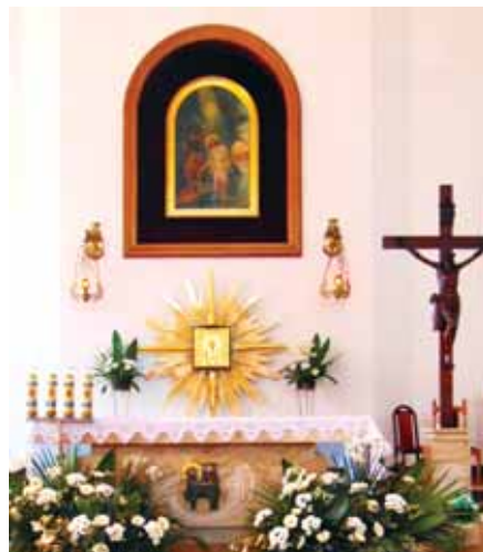
Ołtarz główny z położoną glorią wokół tabernakulum.

Także w nawie bocznej od strony północnej pomalowano ścianę, stanowiącą tło ołtarza z figurką Matki Bożej Fatimskiej. Kolor ściany jest teraz blade-niebieski, dobrany do koloru sukni Matki Bożej. Odnowiony został również łukowaty napis nad figurką Matki Bożej, nadając mu kolor matowego złota. Prace malarskie wykonał Józef Jucha z Sitkówki. Tak odnowiony ołtarz stał się bardziej wyrazisty i piękniejszy. W tym okresie zakupiono ozdobny relikwiarz na relikwie bł. Rodziny Ulmów z Markowej, która 10 września 2023 r. została wyniesiona na ołtarze. Relikwiarz ufundowali rodzice dzieci, które 12 maja 2024 r. przystąpiły do Pierwszej Komunii Świętej. ■