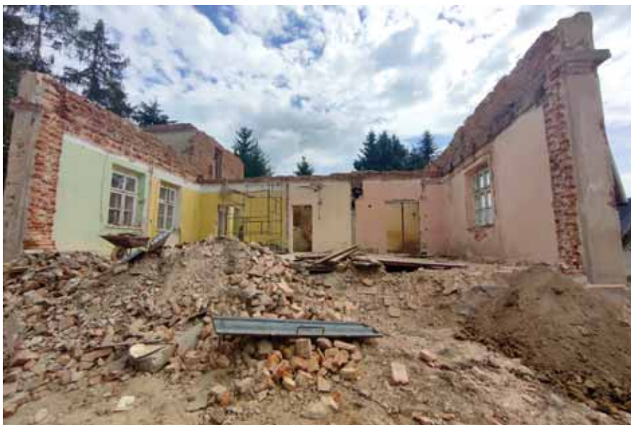
Przebudowa zabytkowego budynku byłej plebani w Świlczy – w tym miejscu powstanie żłobek.