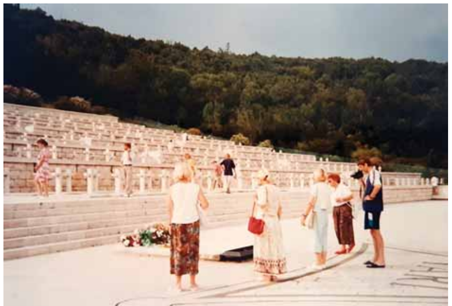
„Czy widzisz ten rząd białych krzyży, tam Polak z honorem brał ślub...”.

klasztor, stanowiący część niemieckiej Linii Gustawa, stał się symbolem bohaterstwa polskich żołnierzy, którzy z dala od domu oddawali życie za wolność swojej ojczyzny.