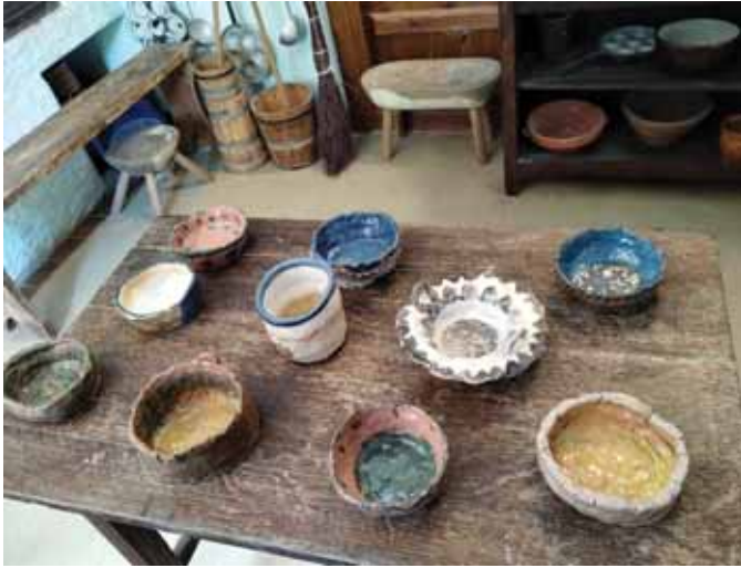
Prace ceramiczne pensjonariuszy DS w Trzcianie.