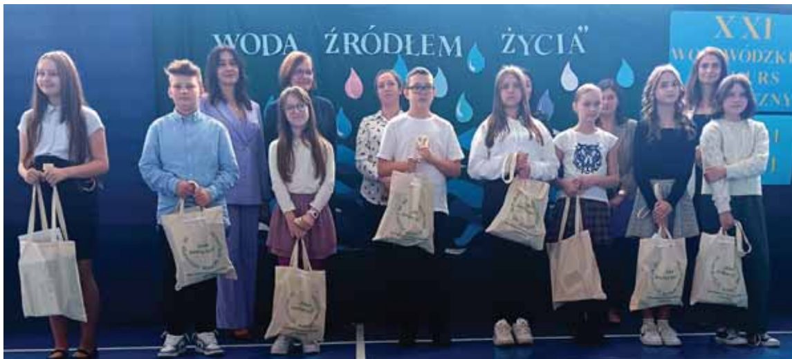
Nagrodzeni w kategorii kl. IV-VI SP.