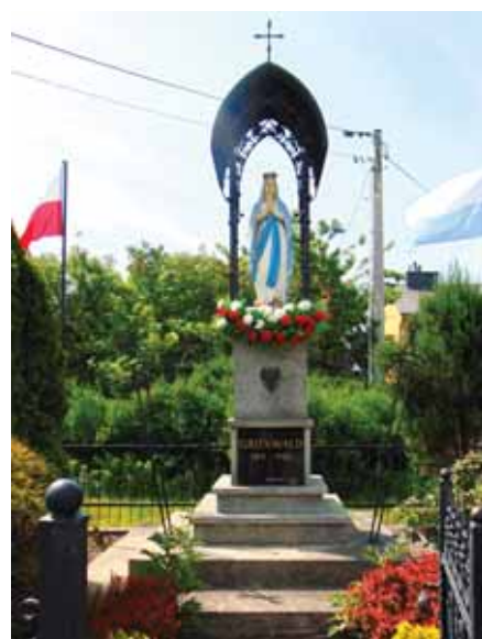
Kapliczka – pomnik Grunwald w Sitkówce, 2024 r.

W 1999 r. kapliczka ta została gruntownie odnowiona. Jej cokół obłożono płytami granitowymi. Na frontowej części cokołu umieszczono granitową tablicę, na której wygrawerowano napis: „Grunwald 1410-1910, Odnowiony: 1999 r.”; a wyżej wizerunek orła polskiego odlanego w brązie. Na cokole kapliczki umieszczono oszkloną obudowę z PCV, a wewnątrz postawiono zabytkową figur-