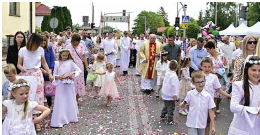
Dziewczynki posypywały drogę płatkami kwiatów, a chłopcy dzwoniли dzwoneczkami.

strażacy ochotnicy. Tradycyjnie przypadł im w udziale zaszczyt niesienia baldachimu i chorągwi kościelnych oraz zabezpieczanie ruchu drogowego na trasie przejścia procesji. W tej barwnej rozmodlonej i rozśpiewanej procesji, uczestniczyli licznie parafianie, małe dziewczynki w białych sukienkach posypujące kolorowe płatki kwiatów na drodze niesienia przez księdza monstrancji z Najświętszym Sakramentem oraz chłopcy w białych komeżkach dzwoniący dzwoneczkami. To wszystko tworzyło niezwykle radosną i odświętną atmosferę, nadając procesji wyjątkowo uroczysty charakter.