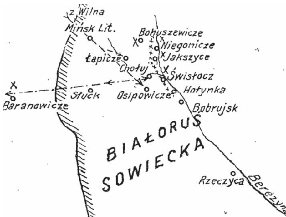
Działania 17 pp nad rzeką Berezyną wiosną i latem 1920 r.