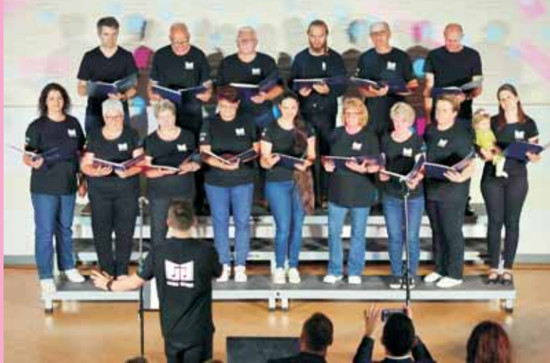
Chór „Gamma” ze Świlczy