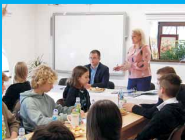
Spotkanie organizacyjne MRG V kadencji.