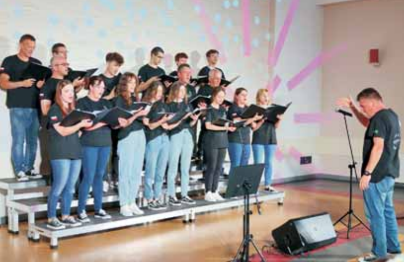
Chór „Cantus” z Trzciany