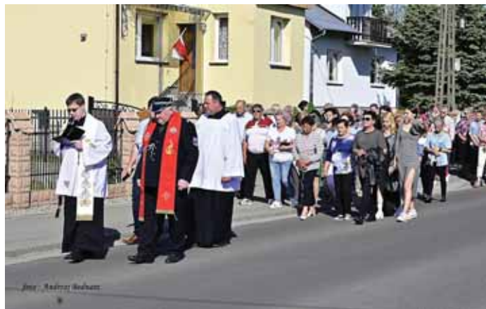
Po wspólnej modlitwie przed kapliczką wszyscy na czele z księżmi, udali się do kościoła.