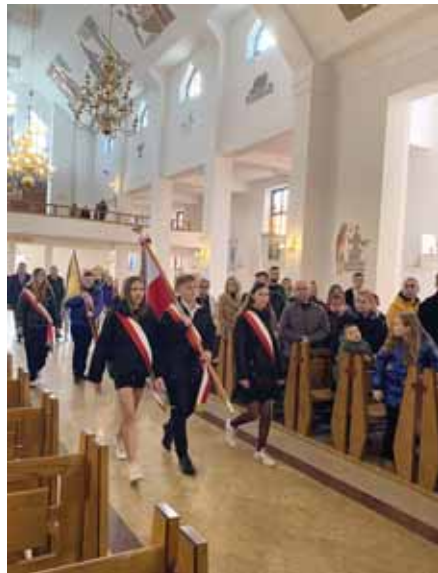
Poczty sztandarowe młodzieży w świątyni.