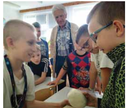
SP Niechobrz, 3 czerwca 2024 r. „Jak to z chlebem bywało”.