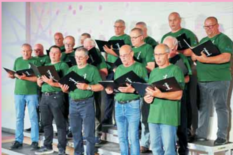
Chór „Resonantae” z Bratkowic