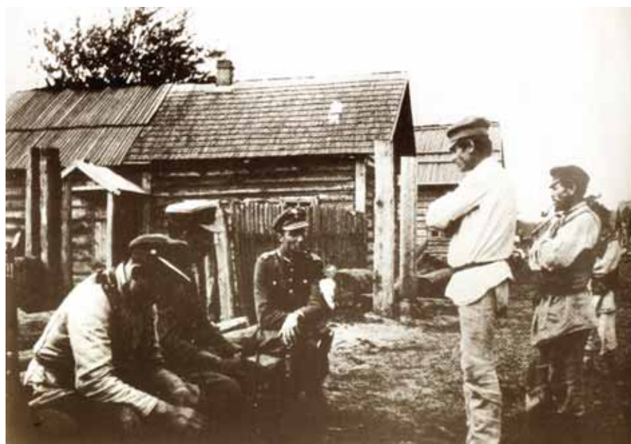
Polscy żołnierze w białoruskiej wsi podczas rozmowy z miejscowymi chłopami. Fot. archiwum

[CAW, Kolekcja Orderu Wojennego Virtuti Militari: I.482.95-9404]