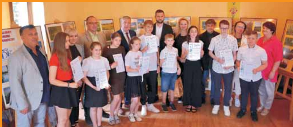
Tradycja interesuje mądrych.