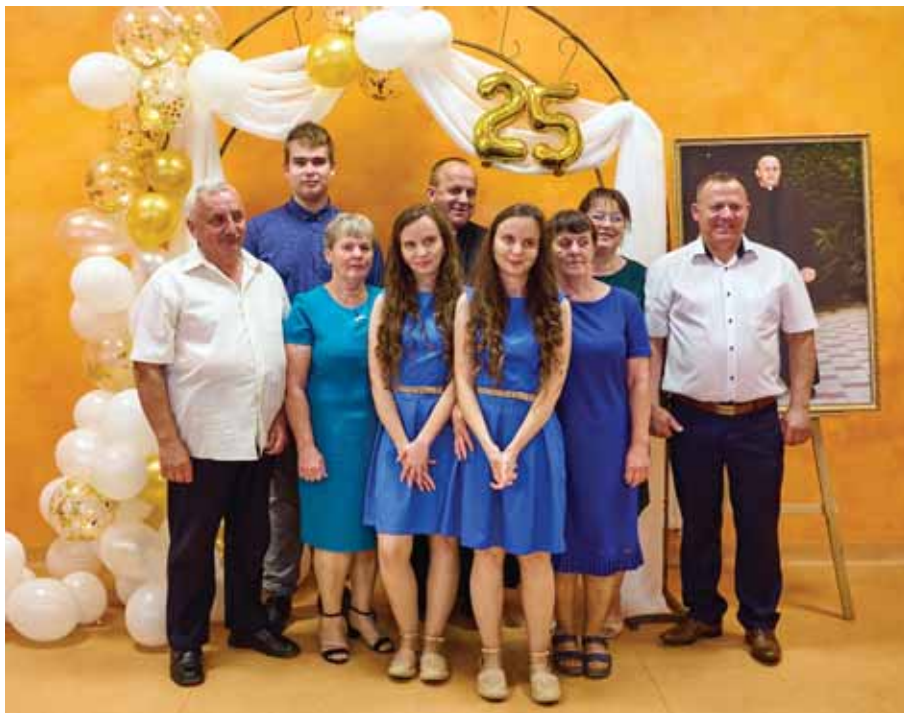
Jubilat w otoczeniu rodziny.

Poniżej zamieszczam oryginalne teksty podziękowań.