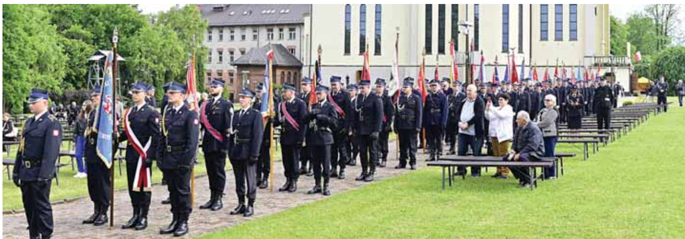
Strażacy podczas pielgrzymki.

W słowach skierowanych do wszystkich uczestników strażackiej pielgrzymki Biskup Rzeszowski, powiedział: „(...) Drodzy Strażacy, przybyliście tu do Matki Bożej, by w Jej domu przede wszystkim dziękować za wszystkie otrzymane łaski, za każdy szczęśliwy powrót z akcji. Za opiekę Waszego Patrona Świętego Floriana. Przybywacie także, by prosić o nowe, kolejne łaski. By upraszać przychylność, życzliwość, obecność Matki Najświętszej w Waszym życiu osobistym, rodzinnym i zawodowym. Pielgrzymka to także okazja, by przepraszać. Jednym z wymiarów każdej pielgrzymki jest ten wymiar pokuty. Tak było dawniej i oby tak pozostało. Ojcowie spowiednicy oczekują w konfesjonatach. Każdy, kto chciałby się dzisiaj pojednać z Bogiem, zyskać potrzebne nam wszystkim łaski, może skorzystać. To jest ważny moment i akcent każdej pielgrzymki. (...) Ludzie munduru wiedzą co znaczy służba. Wiedzą co to znaczy to niezwykle powołanie i wierność zawołaniu: „Bogu na chwałę, ludziom na ratunek”. Dziękujemy Wam serdecznie za tę Waszą dyspozycyjność, za ten pośpiech, by ratować człowieka, jego życie, zdrowie, dobytek, mienie. Być zawsze gotowym do niesienia pomocy – właśnie za tę gotowość Wam dziękujemy, cenimy i chylimy dzisiaj czoła przed Waszymi Sztandarami. Dziękując, jedno-