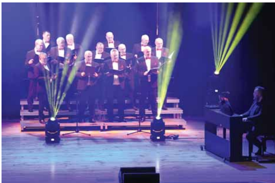
Kobietom chórzyci „Resonantae” śpiewają z serca...