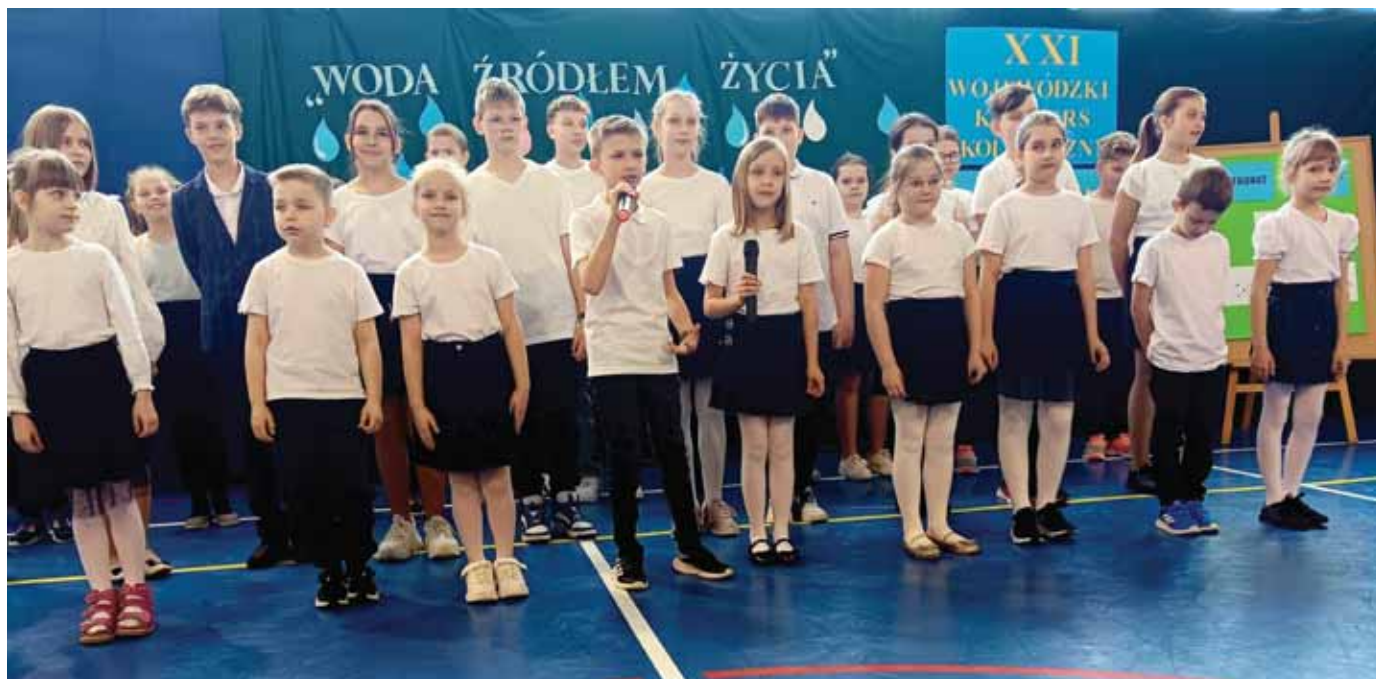
Program artystyczny w wykonaniu uczniów szkoły.