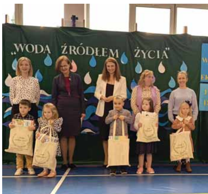
Nagrodzeni w kategorii wiekowej Przedszkole – kl. 0.