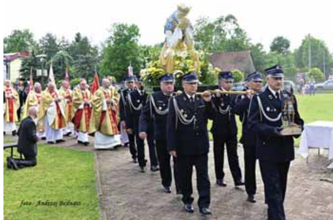
Uroczyste przeniesienie figurki Matki Bożej Saletyńskiej na podwyższenie ołtarza polowego.